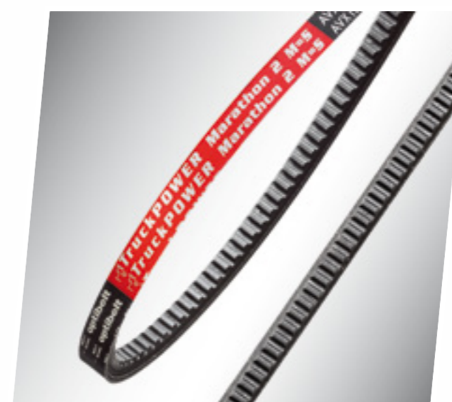
Клиновой ремень ОПТИБЕЛТ MARATHON 2 M=S