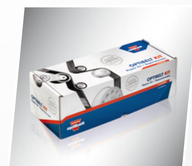
Ремонтный комплект ОПТИБЕЛТ KIT