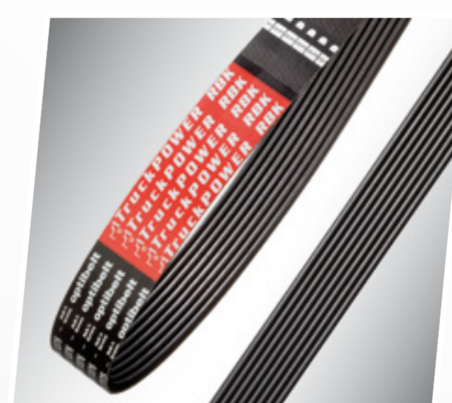
Поликлиновой ремень ОПТИБЕЛТ RBK